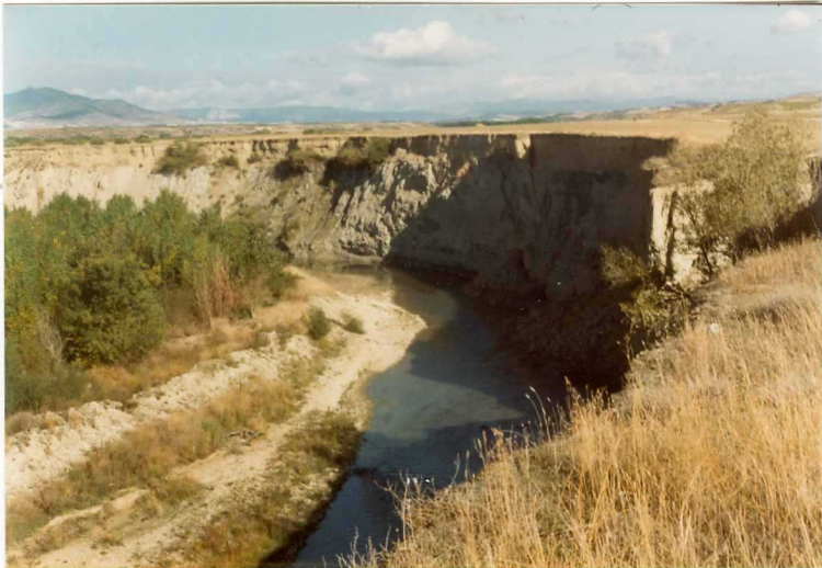
FOTO 2.- Aspecto de las Margas con niveles de yeso, de la unidad (16) 9003 en el corte de un meandro del rio Ega al NE de Lerin.