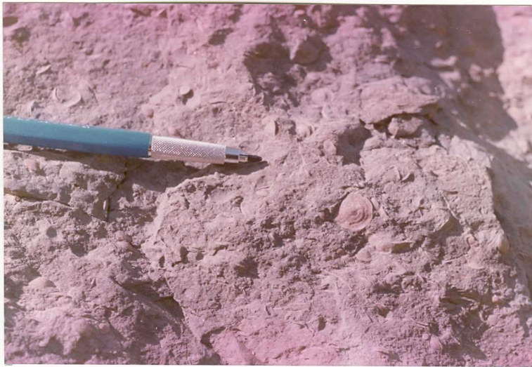
FOTO 9.- Detalle de las Margas grises con Orbitolinas, de la unidad (3) 9005 en la carretera de Estella a Vitoria.