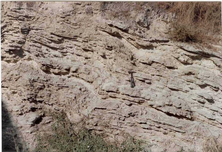
FOTO 21.- Detalle de la unidad (17). Yesos de los Arcos, en la local- 9013 dad de Lein