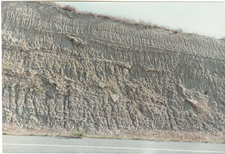
FOTO 1.- Aspecto de la unidad de Larraga (14). Arcillas con niveles de 9008 areniscas de ripples, en la carretera de Allo a Lerin.