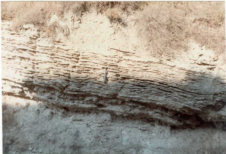
FOTO 9012.- Detalle de la unidad (17). Yesos de los Arcos, en la localidad de Lein