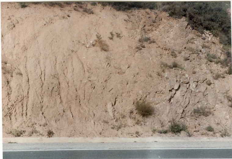
FOTO 9007.- Contacto entre las unidades de Allo (12) y los conglomerados de Muniain.