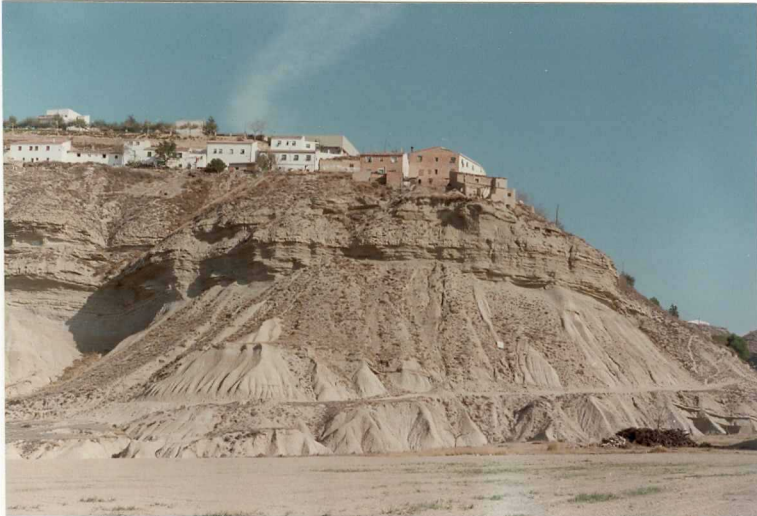
FOTO 9010.- Panorámica del contacto entre las unidades (16). Margas con niveles de yesos y la (17). Yesos de los Arcos, en la localidad de Lerín.