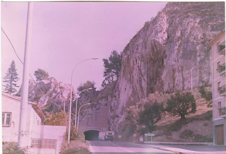
FOTO 2.- Vista de las Calizas con Nummulites del Luteciense (Unidad 6), 9004 en la localidad de Estella.